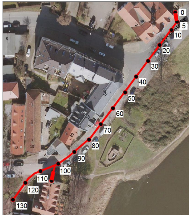
Verlauf des Sandsackdamms; Zahlenangaben in Meter Die Verzweigung soll die Wirksamkeit des Sandsackdamms bis zu einem Wasserstand von ca. 900 cm Pegel Dresden bei möglichem Versagen des Objektschutzes des Gebäudes Altmickten 1 (Lindenschänke)sicherstellen.