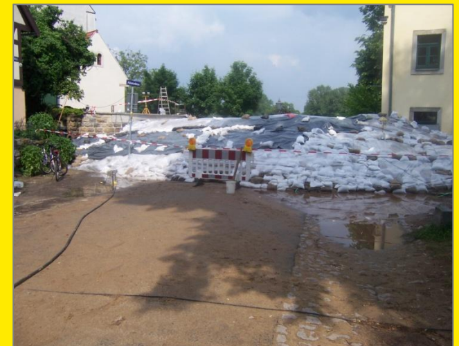
Sandsackdamm in Altmickten beim Elbehochwasser Juni 2013

Aufbauanleitung für einen Sandsackdamm zum Schutz vor Elbehochwasser mit Wasserständen von 700 bis 900 cm Pegel Dresden