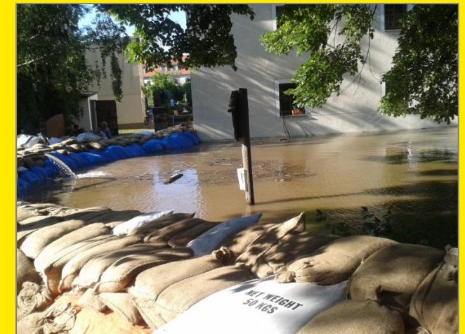
Sandsackdamm in Altübigau beim Elbe-Hochwasser Juni 2013

Aufbauanleitung für Sandsackdämme zum Schutz vor Elbehochwasser mit Wasserständen von 800 bis 900 cm Pegel Dresden